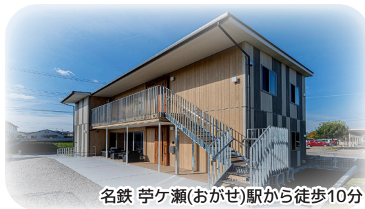
名鉄 苧ヶ瀬(おがせ)駅から徒歩10分