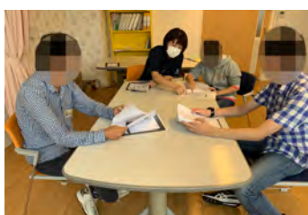
ビジネスマナーの座学