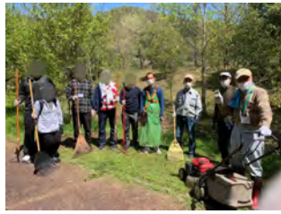
シデコブシの丘の清掃