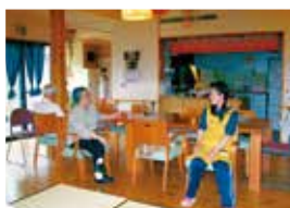
リビングでおしゃべり

木をふんだんに使った和風のグループホームです。家庭的で温かい雰囲気の中で皆一緒に大家族で楽しく暮らしています。今日は隣のプラザ&メゾンにある美容院やレストランにお出かけです。天気の良い日は畑仕事も楽しみです。