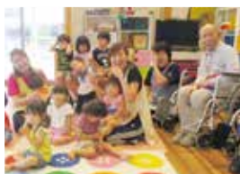
事業所内託児所ショコラの子ども達

日当たりが良好で、テラスへ気軽に出られる環境にあり開放感があります。敷地内の芝生や、建物内の交流スペースは、託児や学童でお預かりしている子供達の遊び場所となっており、子供達と交流する機会も多く笑顔にあふれています。