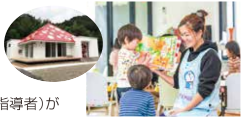
それいゆの子どもたちとの交流