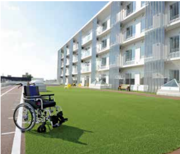
広いリハビリガーデン