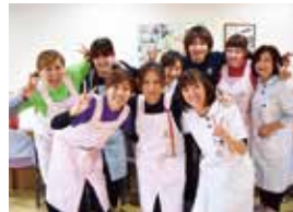
私たちがサポートします

また、入所者の方が居宅での生活を1日でも長く継続できるよう、短期入所療養介護や通所リハビリテーションといったサービスを提供し、在宅ケアを支援することを目的とした施設です。