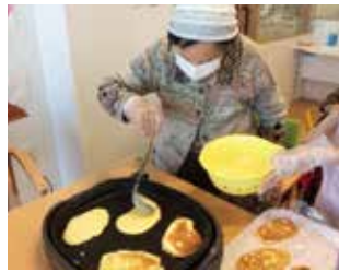
調理作業によるリハビリ