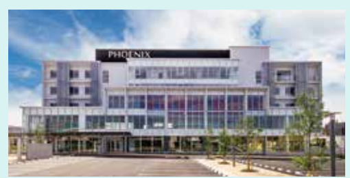
メディカルセンターフェニックス