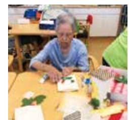
工作によるリハビリ