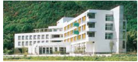
サンバレーかかみ野