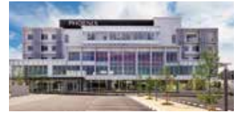
メディカルセンターフェニックス (フェニックス総合クリニック)

地域包括支援センターかかみ野、フェニックス地域連携室、フェニックス在宅相談センターの3部門をフェニックス総合クリニック内に設置することによりご相談を迅速にかつ最善の支援を可能に出来る体制が整っています。