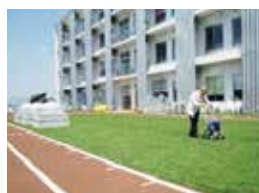
リハビリガーデン

フェニックス総合クリニックに併設され医療フォロー体制も充実しております。広いリハビリガーデンを利用し、屋外で歩行訓練等を行うことができます。「クネット」手すり、レッドコード、パワーマシンを利用し専門スタッフによる個別リハビリを行っています。