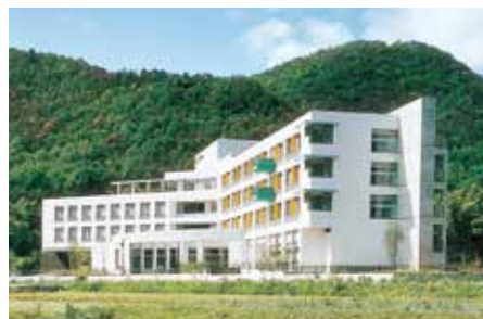
サンバレーかかみ野

広々としたフロアと陽光の降り注ぐ中庭では「きらら」ならではの開放感を味わいながらケアを行っています。併設の託児所の園児たちとの楽しい時間も魅力です。利用者様の「人生をもうひと花咲かせる」ために多職種連携でお手伝いさせていただきます。