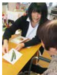
言語聴覚士による リハビリ