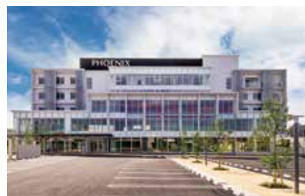
フェニックス総合クリニック

フェニックス総合クリニックに併設され医療フォロー体制も充実しております。広いリハビリガーデンを利用し、屋外で歩行訓練等を行うことができます。「クネット」手すり、レッドコード、パワーマシンを利用し専門スタッフによる個別リハビリを行っています。