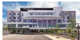
メディカルセンターフェニックス (フェニックス総合クリニック)

地域包括支援センターかかみ野、フェニックス地域連携室、フェニックス在宅相談センターの3部門をフェニックス総合クリニック内に設置することによりご相談を迅速にかつ最善の支援を可能に出来る体制が整っています。