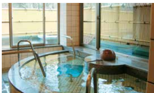
庭を眺めながら入るお風呂