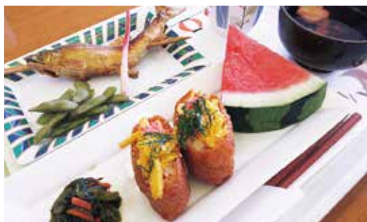
季節を楽しんでいただける食事