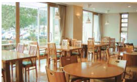
季節の料理を提供するレストラン

毎日の食事は、栄養士によって入居者皆様の嗜好や栄養バランスに配慮して作られた専用メニューです。