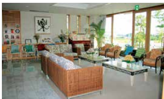
おしゃれなロビー