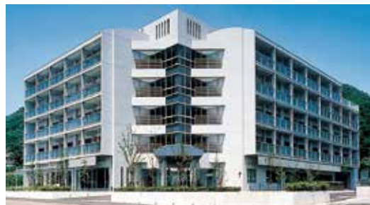
ケアハウスだんらん