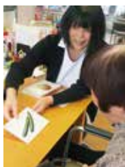
言語聴覚士による リハビリ