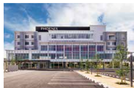
フェニックス総合クリニック