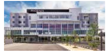
メディカルセンターフェニックス (フェニックス総合クリニック)

地域包括支援センターかかみ野、フェニックス地域連携室、フェニックス在宅相談センターの3部門をフェニックス総合クリニック内に設置することによりご相談を迅速にかつ最善の支援を可能に出来る体制が整っています。