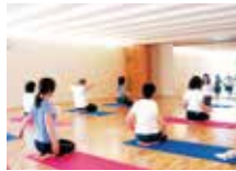
リラクゼーションヨガ