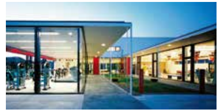
健康館 フェニックス

病気を治す医療医学から病気にならない・ボケない予防医学、アンチエイジング〔抗加齢〕医学へ。 「生活習慣病に負けないためには、健康をいつも意識すること、適度な運動を続けること」が大切です。