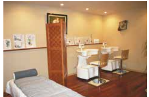
アルカディアルーム