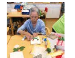
工作によるリハビリ