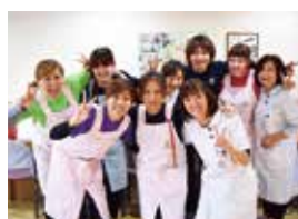
私たちがサポートします

また、入所者の方が居宅での生活を1日でも長く継続できるよう、短期入所療養介護や通所リハビリテーションといったサービスを提供し、在宅ケアを支援することを目的とした施設です。