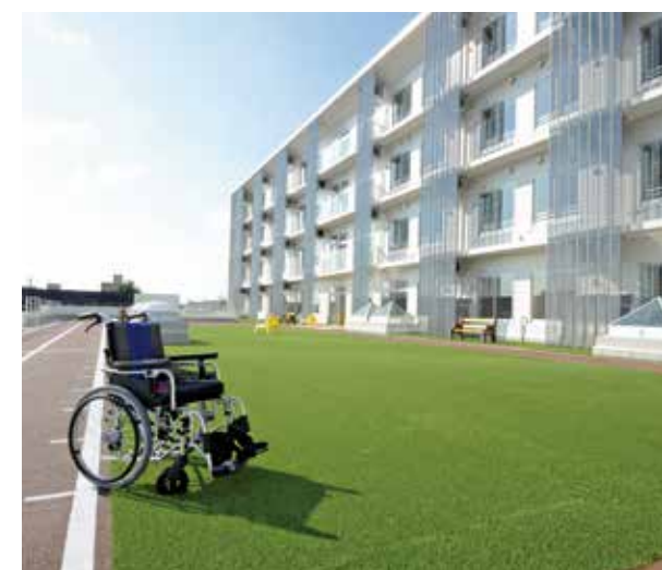
広いリハビリガーデン