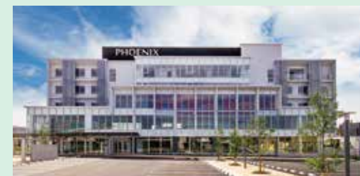
メディカルセンターフェニックス