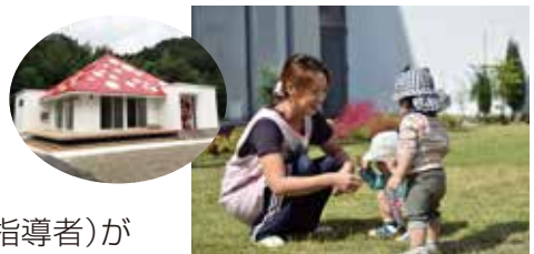
それいゆの子どもたちとの交流