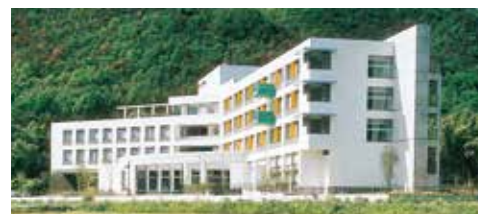
サンバレーかかみ野