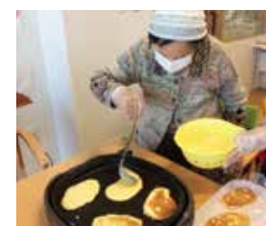
調理作業によるリハビリ